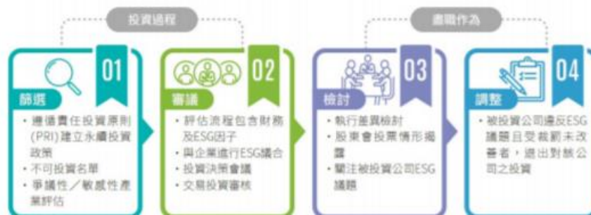
圖：動態盡職治理-投資流程四步驟

為檢視政策內容之目的是否有確實執行，本公司有四階段的投資流程，分別為投資前之篩選、審議，以及事後的檢討及調整，執行成果於后頁說明。